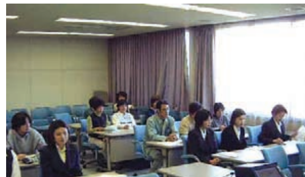
(環境講座の受講風景)