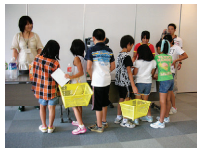
「どれにしようかな～?」

家庭からでるごみの半分以上を占めるのが容器包装のごみ。これをどう減らすかを、模擬スーパーマーケットへの買い物を通して考えます。わかりやすく楽しく、子どもにも大人にも人気の講座です。