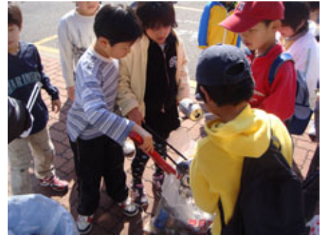
写真①クリーン大作戦

各自の自宅から川島地区市民センターまで、歩いて道路や水路、公園や空き地、川などに不法投棄された空き缶、空きビン、ペットボトル容器などのポイ捨てゴミを回収し分別しました。そのあとは環境啓発ビデオをみんなで見て生活環境の大切さを学びました。