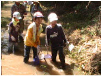
写真②水生生物調査

鹿化川の水質調査を行うため、水生生物による調査を行いました。毎年つづけている活動で、今回はⅡできれいな方から2