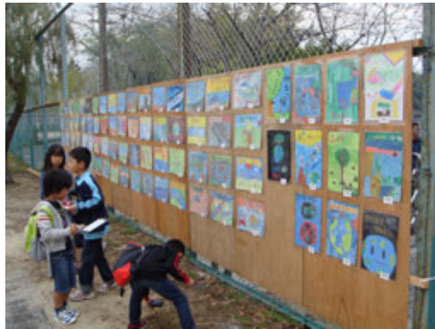
写真③環境ポスター展

川島小学校の4年生に環境に関するポスターを画してもらい、川島地区文化祭において、来場された方に見ていただきました。