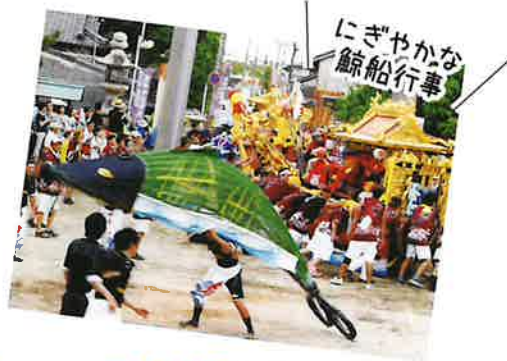
にぎやかな鯨船行事