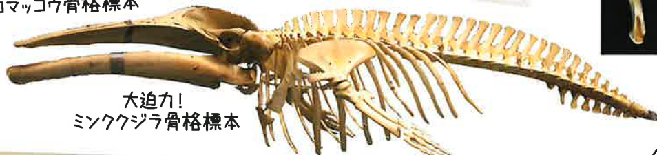
大迫力! ミンククジラ骨格標本