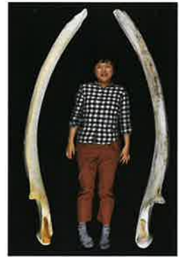
おっきなザトウクジラ下あご