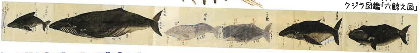
江戸時代のクジラ図鑑「六鯨之図」