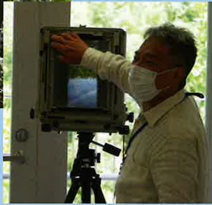
写真家松原 豊さんによる写る仕組みの説明